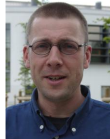
apl. Prof. Dr. Niko Paech, Universität Oldenburg, Ökonom

der "solidarischen Ökonomie" ist zu entwickeln, die die JESUS-Mentalität des Teilens praktiziert: Teilen von Bildung, Arbeit, Einkommen und Wohlstand, in der der Mensch, nicht Geld und Profit, an erster Stelle steht.“